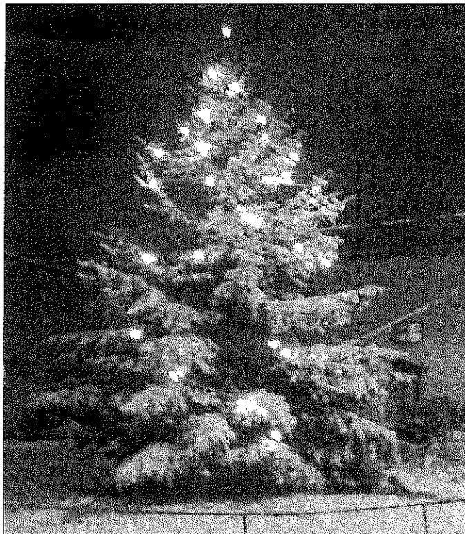
VÁNOČNÍ STROM PŘED OBECNÍM ÚŘADEM V DALOVICÍCH V PROSINCI 2010