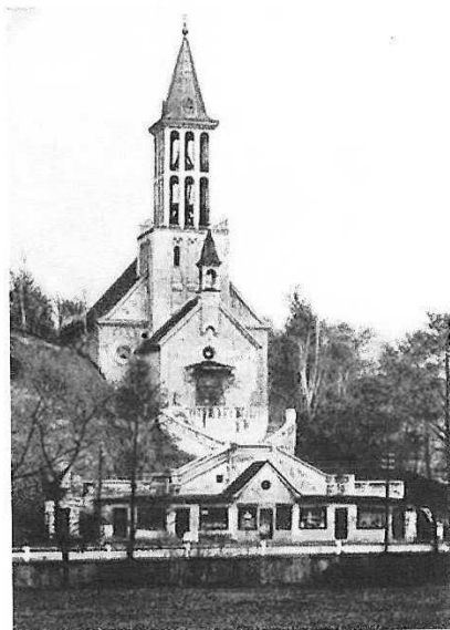
kostel Panny Marie Utěšitelky v Dalovicích před rokem 1945