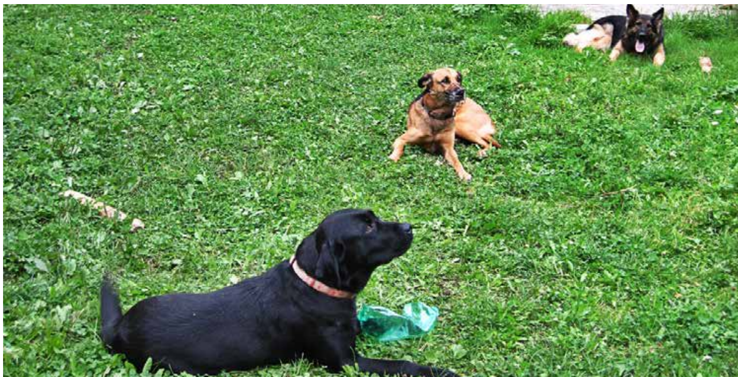
ZÁCHRANNÁ STANICE „U PŘEDNOSTY AVÁJEKA“