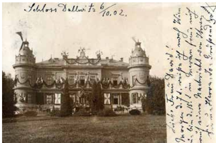
Dobová pohlednice Nového zámku